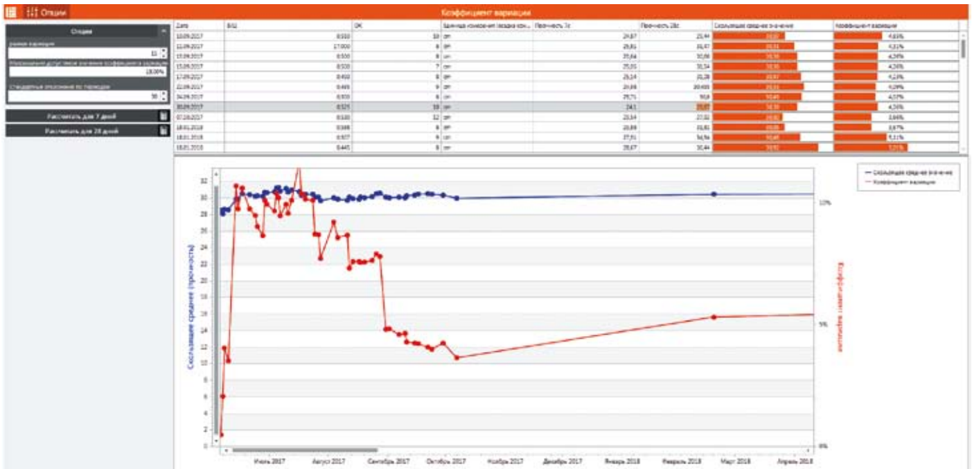
Функция программы «Коэффициент вариации»