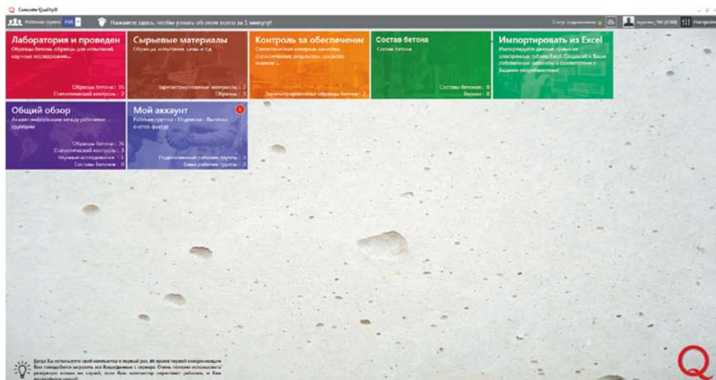
Основная страница программного продукта «АККЕРМАНН бетон»

В настоящее время, предприятия бетонной и железобетонной промышленности заинтересованы в выпуске качественной продукции с минимальными отклонениями от нормативных требований. Благодаря чему бетоны могут изготавливаться с наименьшим из возможных значений коэффициента вариации, что позволяет снизить требования к запасу прочности, сократить расход цемента и уменьшить за счет этого себестоимость продукции, не нарушая нормативных требований к прочности бетона.