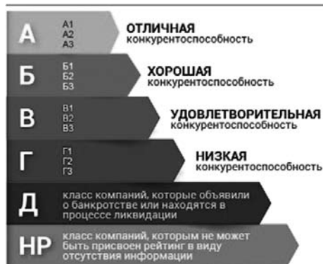
Рисунок 2. Рейтинговая шкала, применяемая Рейтинговым агентством строительного комплекса